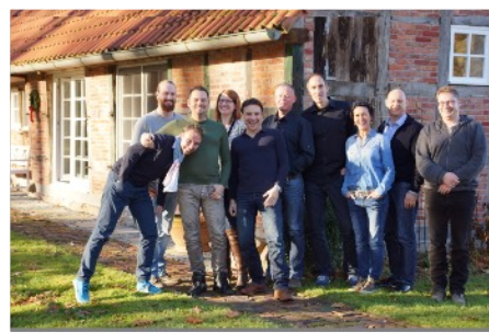
Business Master 2016