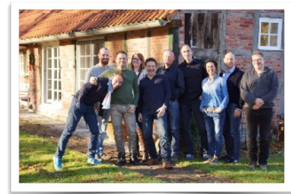
Business Master Gruppe 2016

Für alle, die schon NLP Practitioner sind und... ... Unternehmer/Freiberufler, ... Führungskraft, ... Projektleiter, ... Vertriebsprofi, ... Trainer und Coach, ... BeraterInnen in einem sozialen Berufen, ... an lösungsorientierter Kommunikation interessiert sind.